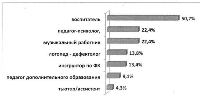
Рис. 2. Наличие вакансий педагогических работников в ОО города Тулы (в %).

По результатам мониторинга полностью укомплектованы педагогическими кадрами 36 (53,7% от общего числа) дошкольных образовательных организаций, частично – 31 (46,3%). Наличие вакансий воспитателя указали 34 образовательных учреждений (50,7%), наличие вакансии узких специалистов (музыкальный работник, педагог-психолог, инструктор по физкультуре, логопед, педагог дополнительного образования) подтвердили руководители 25 образовательных учреждений (37,3%) (рис.2).