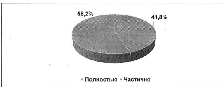
Рис. 3. Обеспеченность ДОО города Тулы учебно-методическими и игровыми материалами (в %).

По данным мониторинга 100% образовательных учреждений города Тулы, реализующих дошкольное образование, обеспечены учебно-методическими и игровыми материалами, однако только 39 образовательных учреждений (58,2%) обеспечены полностью, а 28 образовательных учреждений (41,8%) – частично (рис. 3):